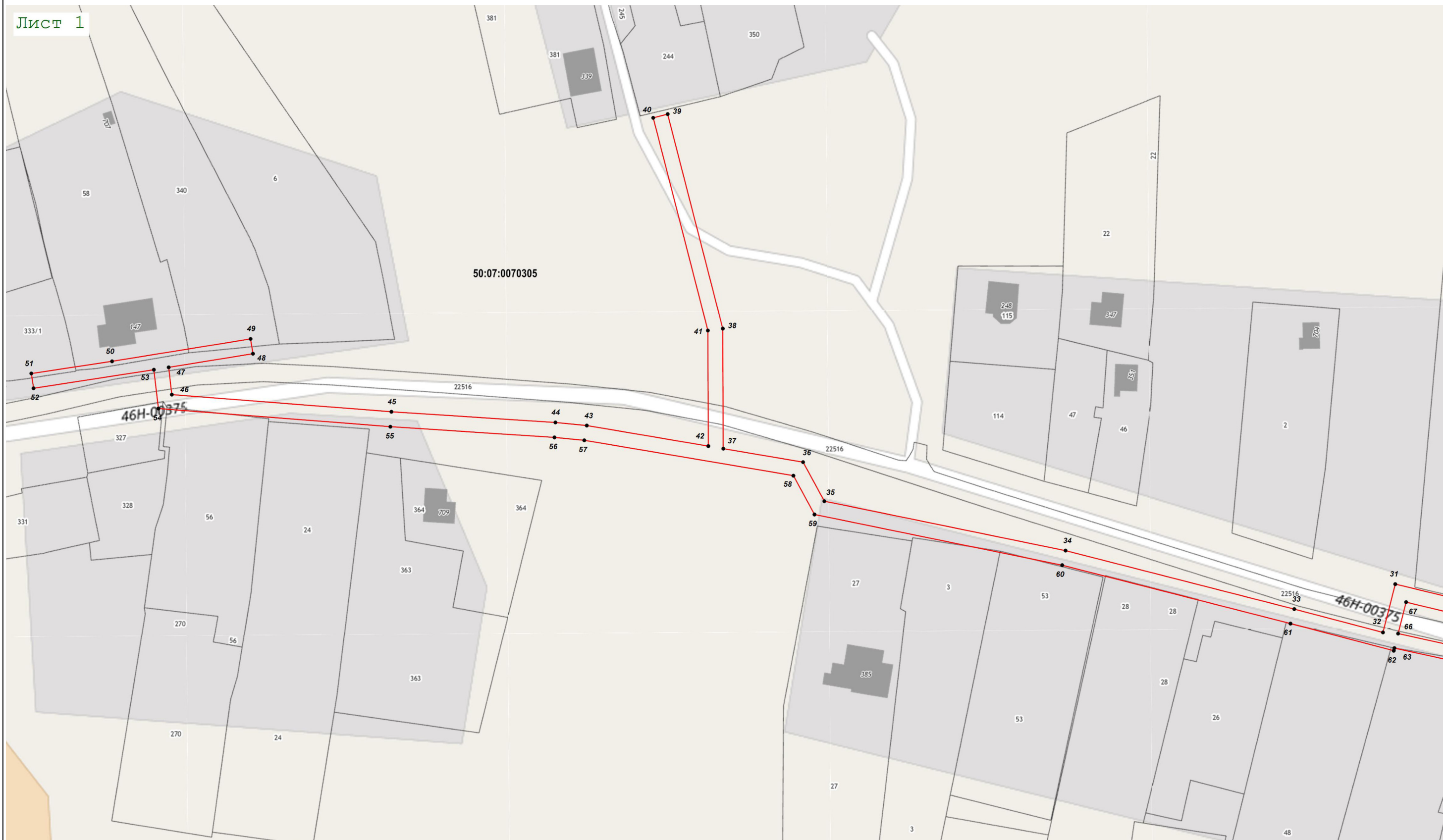
Масштаб 1:1 000